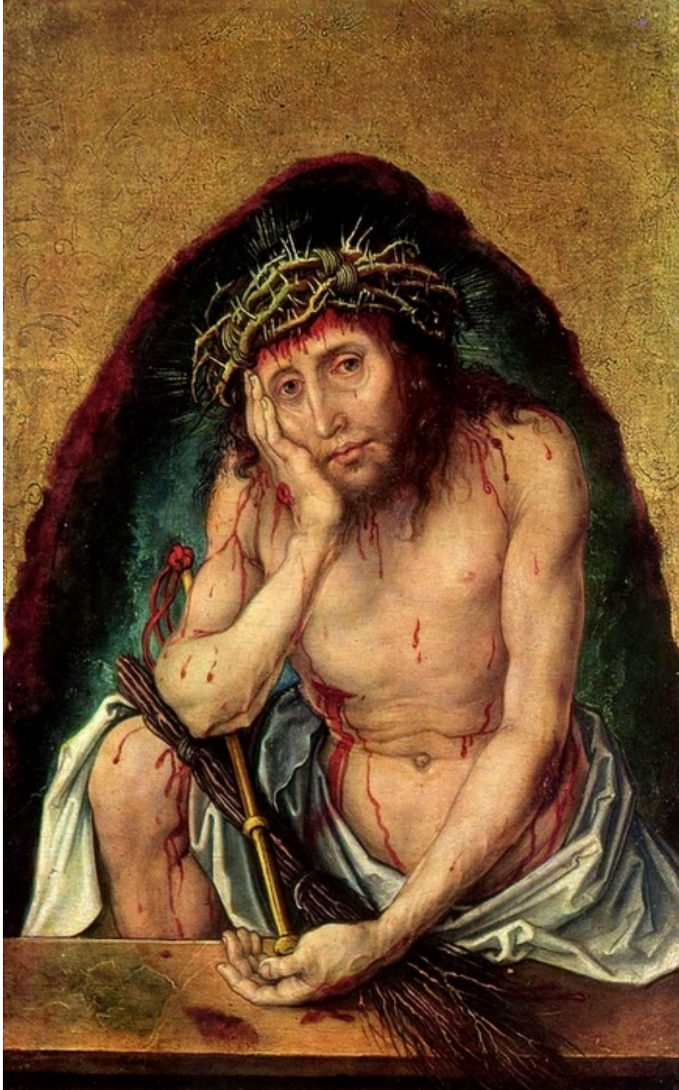
III. Albrecht DÜRER (1493/94) : Ecce Homo , Karlsruhe, Staatliche Kunsthalle.