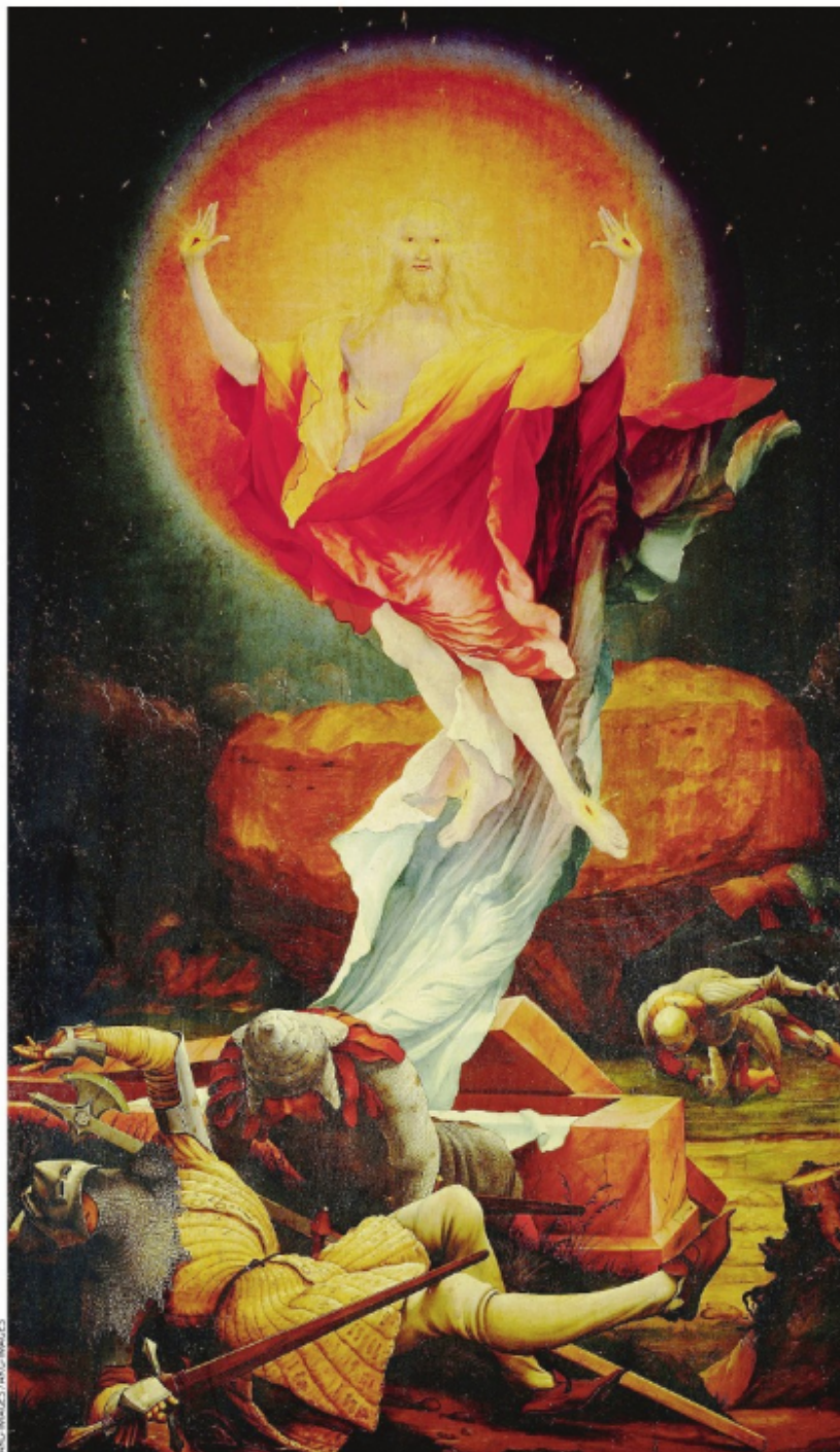
La Résurrection de Mathias Grünewald. Retable d'Issenheim, Colmar, Musée Unterlinden. «Ici, écrit Piero Bianconi, la vision libérée de toute pesanteur est décrite en tant que phénomène lumineux: le personnage divin est peu à peu absorbé par sa propre lumière dans un remous éblouissant...»

XI. GRÜNEWALD : Retable d'Issenheim , Colmar, Musée d'Unterlinden, La résurrection .